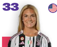
ABI BRIGHTON 29 MARZO 2002