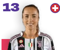
LIA WÄLTI 19 APRILE 1993