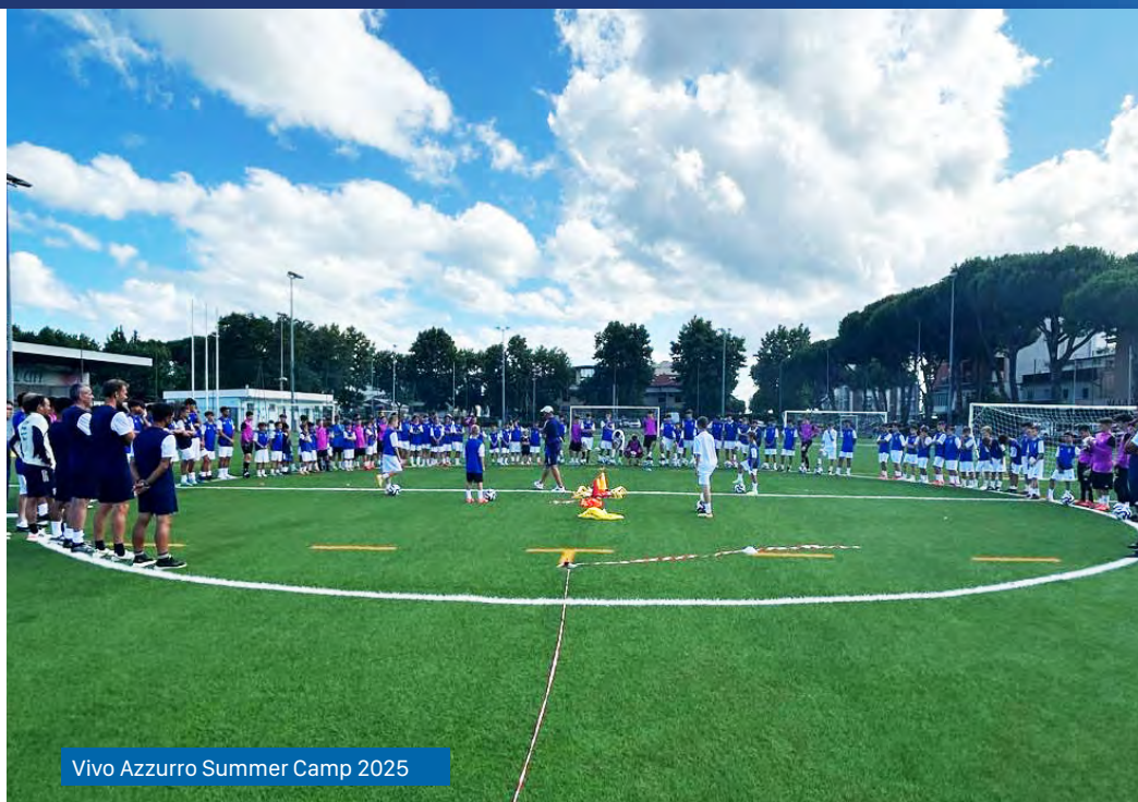
Vivo Azzurro Summer Camp 2025

Il SUMMER CAMP VIVO AZZURRO è il camp di calcio tenuto dagli ALLENATORI E PREPARATORI DELLA NAZIONALE ITALIANA GIOVANILE.