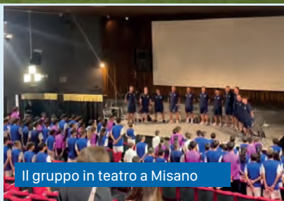
Il gruppo in teatro a Misano