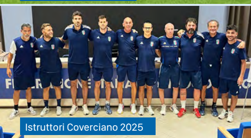
Istruttori Coverciano 2025