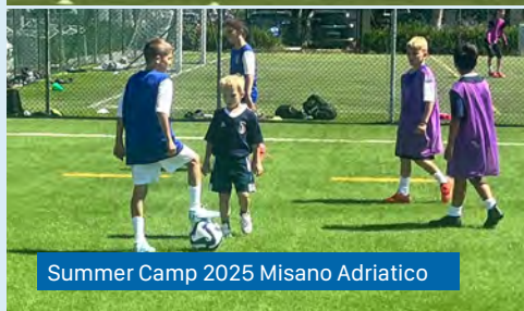
Summer Camp 2025 Misano Adriatico