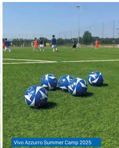
Vivo Azzurro Summer Camp 2025

PER INFORMAZIONI E PRENOTAZIONI tel. 338 136 8879 | vivoazzurrosummercamp@gmail.com