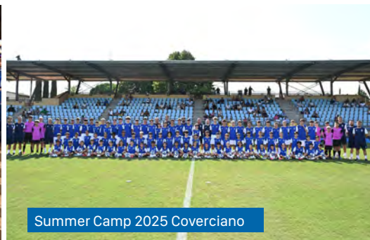
Summer Camp 2025 Coverciano