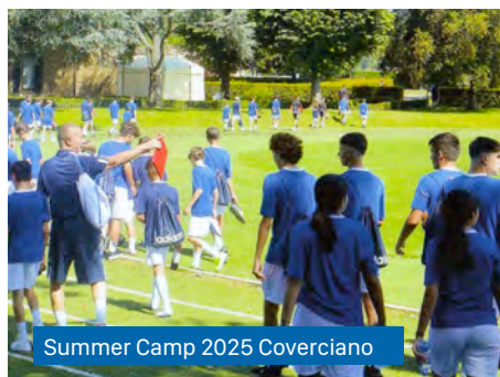
Summer Camp 2025 Coverciano

Tre giorni indimenticabili per vivere nel tempio del calcio italiano come un campione azzurro.