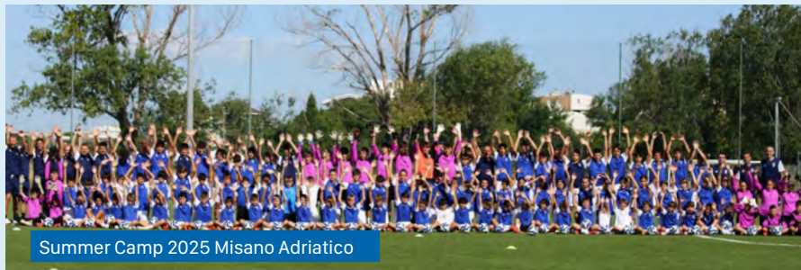
Summer Camp 2025 Misano Adriatico

Misano Adriatico si trova a 5 km da Riccione ed è una delle località più amate della riviera romagnola. Anche quest'anno ospiterà con orgoglio il Vivo Azzurro Summer Camp .