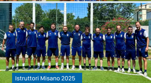
Istruttori Misano 2025