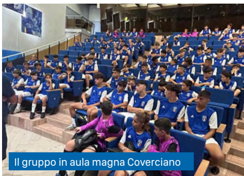
Il gruppo in aula magna Coverciano